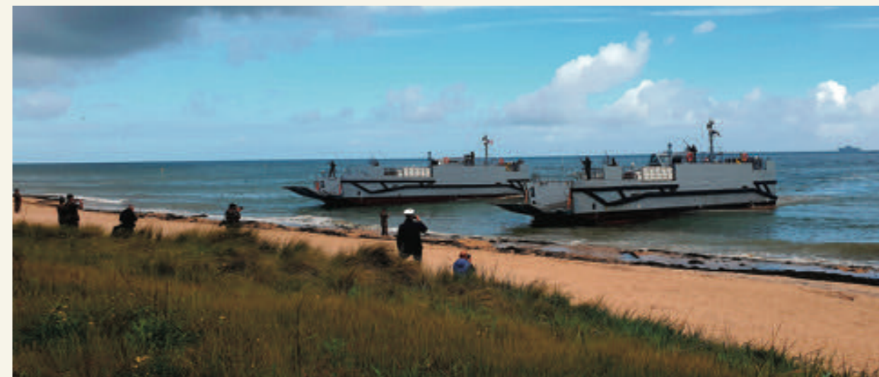
Franske spesialstyrker fikk demonstrere en «ekte» landgang på Sword Beach, 80 år etter. Mye er likt datidens operasjoner, rent bortsett fra at det denne gangen foregikk uten hard tysk motstand og de franske styrkene kunne marsjere fredelig opp på stranda, til applaus fra de mange tilskuerne.