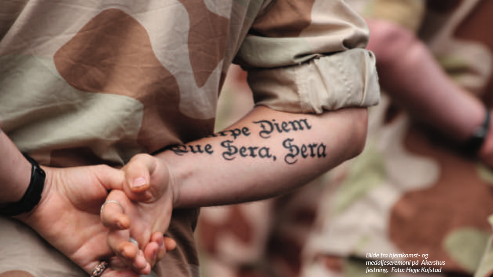
Bilde fra hjemkomst- og medaljeseremoni på Akershus festning.

” - Det er tre domener for posttraumatisk vekst: personlig vekst, som innebærer økt selvtillit og tro på seg selv, relasjonell vekst, som handler om endringer i hvordan man ser på andre mennesker og eksistensiell vekst, som involverer hvordan man ser på verden og livet.