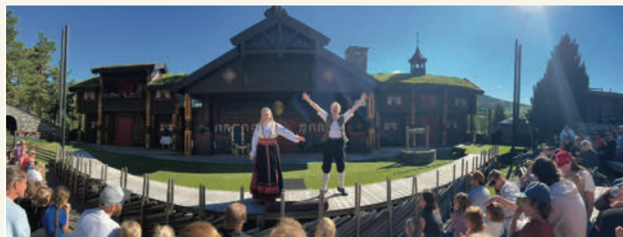
120 små og store hadde en eventyrlig dag i Hunderfossen familiepark med NVIO avd. Gudbrandsdalen den siste dagen i august.