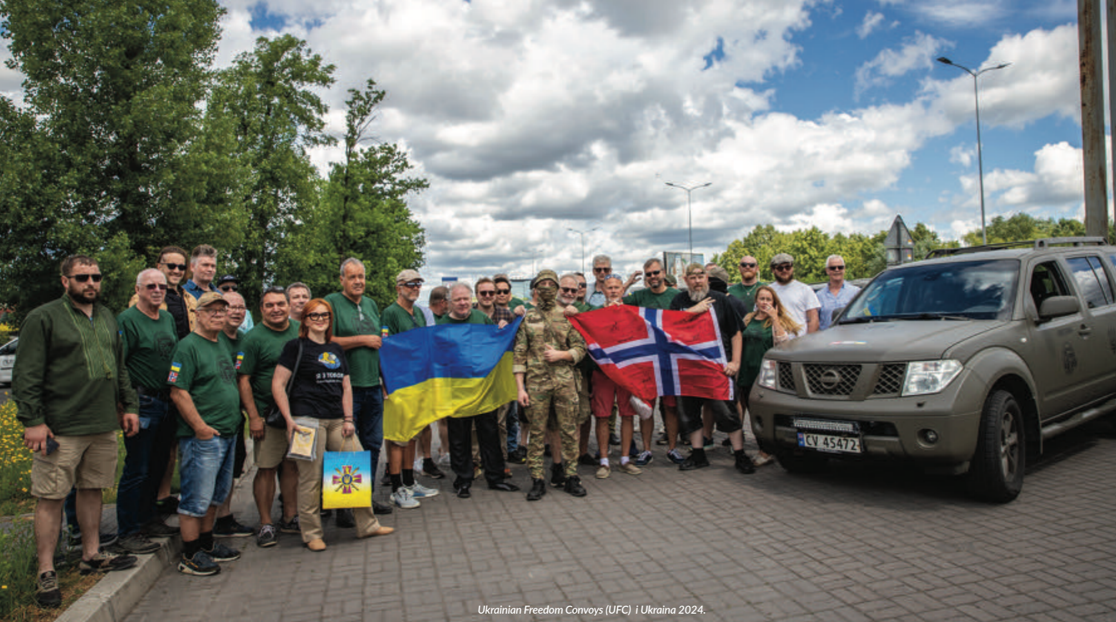
Ukrainian Freedom Convoys (UFC) i Ukraina 2024.