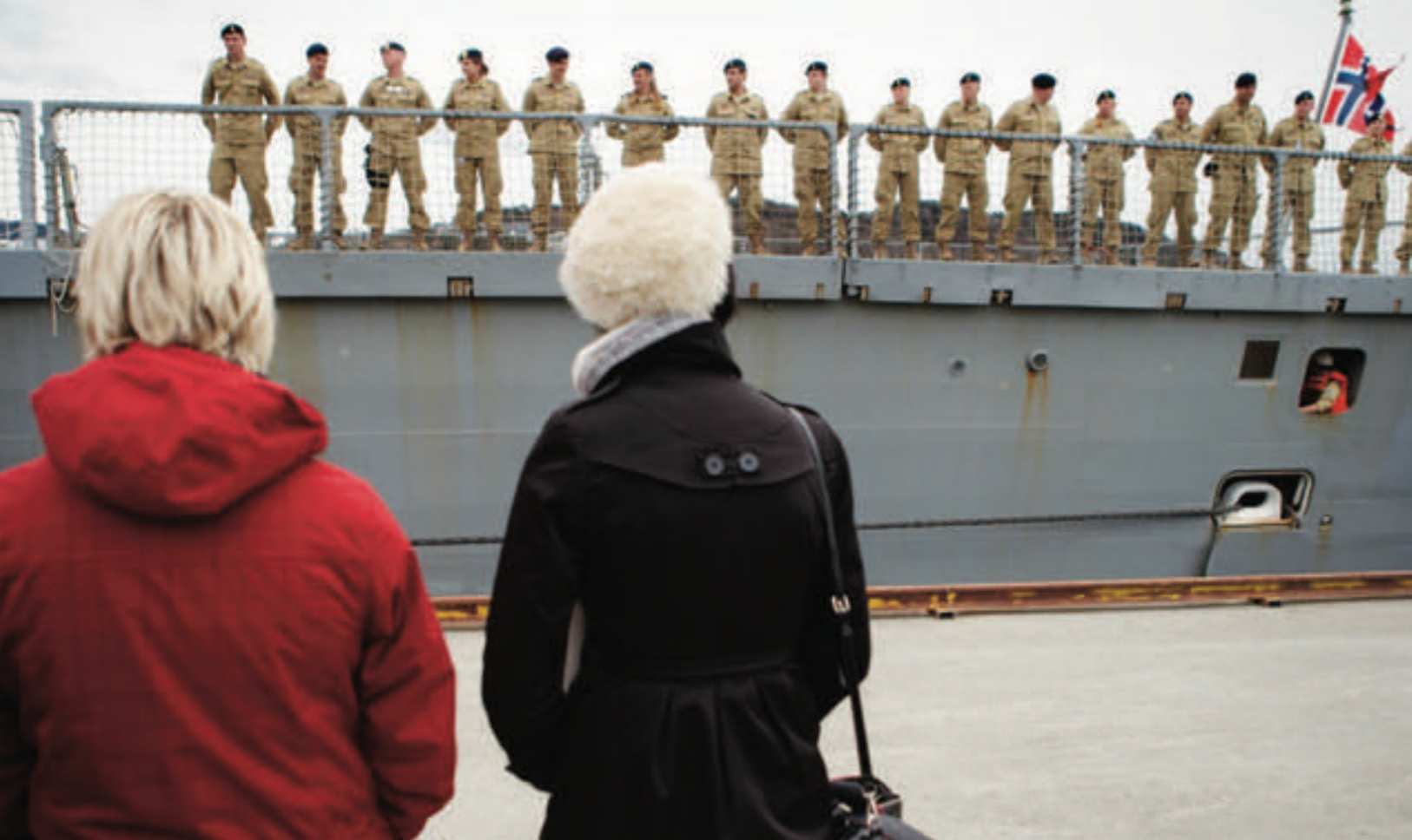
Mannskap på KNM Fridtjof Nansen tar farvel med pårørende under en seremoni i forbindelse med utreise til det indiske hav og Operation Ocean Shield.